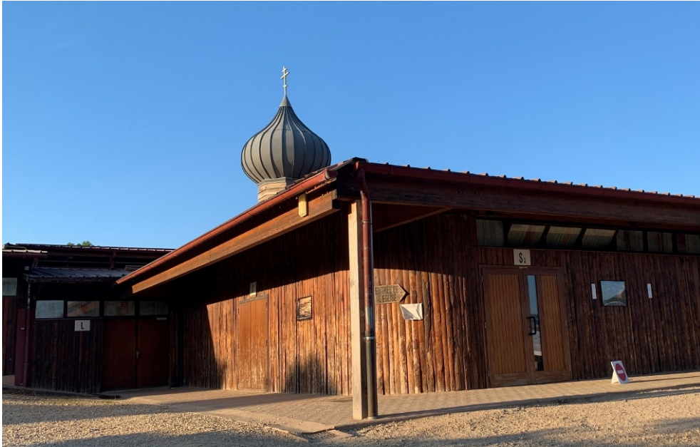
Kirche der Versöhnung in Taizé